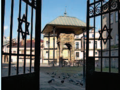
Bimah in Tarnów

In Tarnów ist ein Teil des jüdischen Wohnviertels in der Nähe des Marktplatzes noch erhalten. Im Juni 1942 wurden Tausende jüdischer Bürger auf dem Marktplatz erschossen. Der einzige Rest der zahlreichen Synagogen ist eine große Bimah .