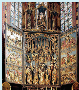
Hochaltar von Veit Stoß