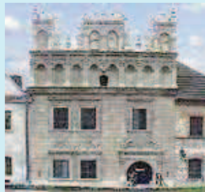
Haus der Familie Celej - heute Stadtmuseum -