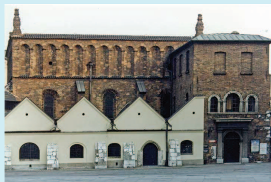
Alte Synagoge – heute Museum

Von den 69.000 Krakauer Juden haben nur wenige den Zweiten Weltkrieg überlebt. Obwohl die Zahl der heute in Kazimierz lebenden Juden sehr niedrig ist, können doch wieder mehrere sehr gut restaurierte Synagogen besucht werden, so die Remuh-Synagoge , die Tempel-Synagoge und die Alte Synagoge , die als Museum für jüdische Geschichte und Kultur dient.