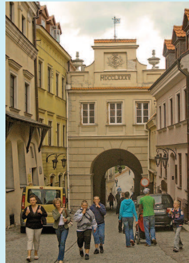
„Brama Grodzka“ / Burgtor - Jüdisches Kulturzentrum -

Das Gebäude der Talmud-Schule „ Jeshiwa “, das erst 1930 offiziell eröffnet worden war, wurde nach dem Einmarsch der deutschen Truppen beschlagnahmt und u. a. als Lazarett genutzt. Nach dem Krieg war dort die Medizinische Fakultät der Universität Lublin untergebracht. Erst vor kurzem wurde das Gebäude an die jüdische Gemeinde zurück gegeben. Von den einst 35 Synagogen bzw. 100 Gebetshäusern besteht heute nur noch ein kleines Gebetshaus in der Nähe des „Platzes der Ghetto-Opfer“.