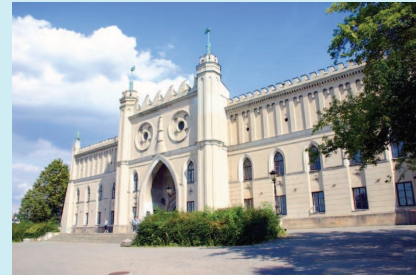
Eingang zur Burg

Geplant ist fernerhin ein Ausflug in das malerische Städtchen Kazimierz Dolny , das im 12. Jahrhundert nach Kazimierz II. benannt und im 14. Jahrhundert von Kazimierz III. zur Stadt erhoben wurde.