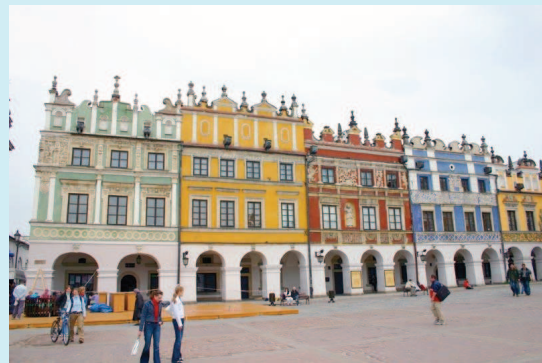
Armenische Bürgerhäuser am Großen Markt

An die jüdische Vergangenheit von Zamość erinnert eine Rotunde , in der nach dem Einmarsch der Deutschen 8.000 Juden erschossen wurden; weitere 6.000 Juden der Stadt wurden nach Belzec deportiert und dort vergast. Außerdem befindet sich in der Nähe des großen Marktplatzes das Gebäude einer ehemaligen Synagoge , das in den vergangenen Jahren als Bibliothek diente. Seit September 2009 finden umfangreiche Restaurierungsarbeiten statt, die bis Ende 2010 dauern werden.