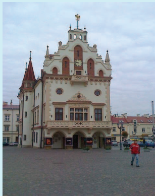
Rathaus von Rzeszów