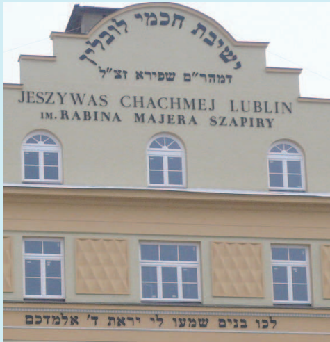
Mittlerer Teil des „Jeshiwa“-Gebäudes, jetzt wieder mit der Originalbeschriftung

Seit kurzem gibt es mehrere interessante Touristenwege durch die Stadt, so auch einen, der auf die große jüdische Vergangenheit aufmerksam macht, nämlich den „Weg des Erbes der Lubliner Juden“ mit 13 Stationen, von denen wir sicher einige besuchen werden.